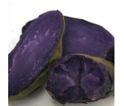
シャドークイーン