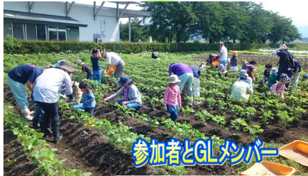
参加者とGLメンバー

○7月8日(土) 「一杯の味噌汁プロジェクト」との活動がありました。この日は大豆の摘心を15組の参加者と一緒に行いました。摘心をするとう脇芽が出て、実の付き方が違ってきます。少しでも多くとれるようにと、暑い中参加者の皆さんとGLメンバーは1時間ほど汗を流しながら摘心をしました。